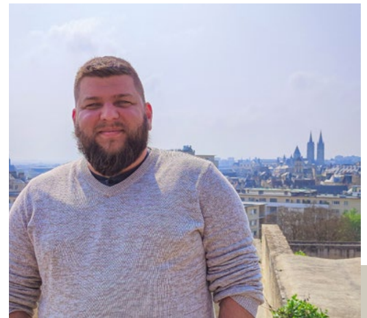
Nota Bene en tournage à Caen au printemps 2023.

Présent sur différentes plateformes, Nota Bene a appréhendé les différents réseaux sociaux avec succès. Sur Facebook, Instagram, Tiktok, Twitch, YouTube et X il réunit plus de 4 millions d'abonnés dont 2,44 millions rien que sur YouTube.