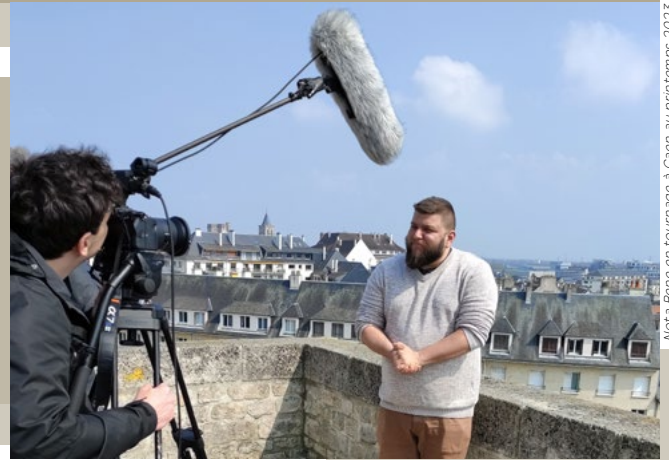
Nota Bene en tournage à Caen au printemps 2023.

L'Office de Tourisme et des Congrès - Caen la mer - Normandie et Caen la mer s'associent avec Nota Bene. L'occasion de faire connaître Sword Beach et de tordre le cou aux idées fausses grâce au célèbre créateur de contenu.