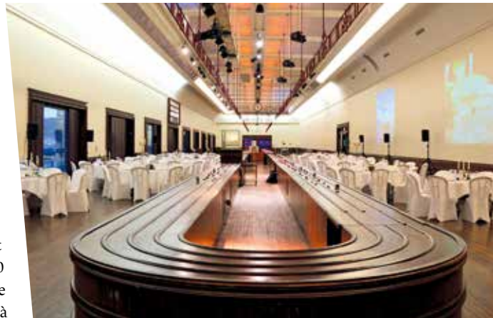
La très élégante Salle des Bagages de la Cité de la Mer

Le Parapluie de Cherbourg installée dans l'ancien siège de la Banque de France produit depuis 1986 une gamme de parapluies de luxe qui s'exporte dans le monde entier (25 000 unités faites main en 2023). On peut visiter les ateliers et la boutique, se réunir dans la salle de cinéma (65 places) et prendre un verre dans les 3 espaces situés dans les étages supérieurs (jusqu'à 30 personnes). À noter que les parapluies offerts lors d'un évènement peuvent être logotés au nom de la société ou des invités. Enfin, mentionnons le Point du Jour , un centre d'art contemporain consacré à la photographie, logé dans un bâtiment contemporain de Cherbourg-Octeville. Au chapitre gastronomie retenons le Pily , la table étoilée de Pierre et Lydie Marion, installée sur le port (carte de la mer, 22 places) ou, sur un registre plus brasserie, le Café de Paris sur le quai de Caligny (50 places) et le Régence , en façade du Théâtre (60 places et salon à l'étage). Au Casino, restaurant Le Sequin , table bistronomique pour 50 personnes. À 30 min de la ville, à Tonneville La Hague, le Planétarium Ludiver invite à un véritable ballet de planètes sous une voûte de 7 000 étoiles (amphithéâtre de 100 places et 2 espaces évènementiels jusqu'à 50 places). N'oublions pas enfin de faire référence à la Villa Les Rhumbs à Granville, la maison d'enfance de Christian Dior, une belle demeure bourgeoise devenue en 1997 le musée Christian Dior, soutenue par le groupe LVMH (réception jusqu'à 100 personnes).