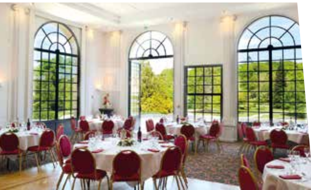
La salle Majestic du Casino