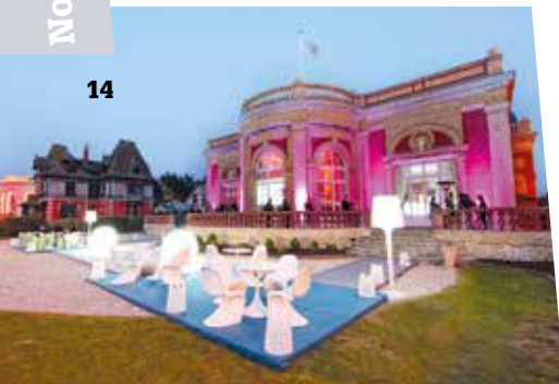
La villa Le Cercle

Sur un registre plus industriel, l' Atelier Hoche , annexé à La résidence Closerie, est un ancien garage automobile reconverti en lieu événementiel de 265 m 2 modulable en 4 espaces pour des réunions et des réceptions jusqu'à 270 personnes. Enfin, en matière de gastronomie, Deauville affiche une belle brochette de tables renommées : outre deux tables étoilées de prestige – Maxim Hellio (35 couverts) et l'Essentiel , à portée de voix du précédent (45 places), quelques nouveautés : le Deauville , dernière adresse du groupe Costes (carte de la mer, 200 personnes), l'Institution , belle brasserie en cœur de ville près du Normandy (carte de la mer, 120 personnes) et Marion , autre brasserie du centre (60 couverts). Au chapitre des