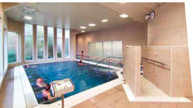
Soins aux Thermes

Ville verte, Bagnoles offre un environnement très nature propre à de nombreuses activités outdoor : marche nordique, randonnées en VTT, parcours acrobatique en forêt, balade en vélo rail sur l'ancienne voie ferroviaire (parcours de 5 km), tir à l'arc, golf sur le parcours 9 trous. Mais aussi, soins au B'o Spa Thermal, atelier de cuisine dans un restaurant (notamment au Manoir du Lys, étoilé Michelin), atelier de cocktails et bien sûr dégustation de cidres au Manoir de Durcet ((jusqu'à 40 personnes).