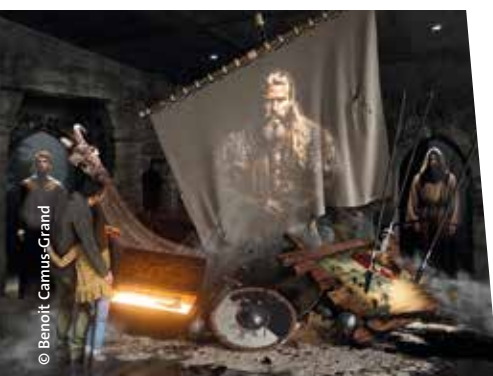
La Cité Immersive Vikings