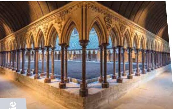
Le Cloître de l'Abbaye

La merveille de l'Occident, deuxième site le plus visité en France après l'Arc de Triomphe, offre un environnement époustoufflant pour un séminaire ou une soirée dans les étoiles.