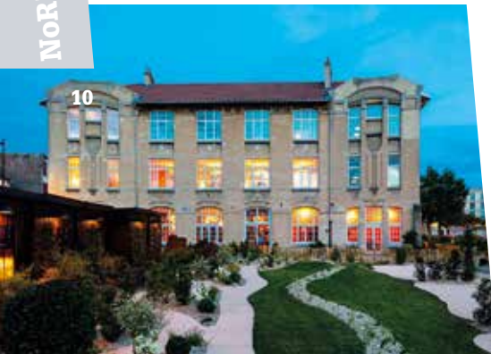
La Grande École

À 30 minutes de la ville, direction Fécamp pour la visite du Palais Benedictine , un ensemble d'inspiration gothique et Renaissance édifié à la fin du XIX e siècle par Alexandre le Grand, un négociant en vin qui a relancé en 1863 la liqueur Benedictine mise au point par des moines. Dans ce qui est aujourd'hui le seul site de production de la marque, on peut à l'issue de la visite du site dédié à l'histoire de la liqueur organiser un cocktail dans la Salle des Abbés (jusqu'à 200 personnes et 160 en banquet), dans la verrière dotée d'un superbe bar (jusqu'à 60 personnes) et dans la salle de dégustation.