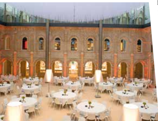
Le Cloître des Franciscaines