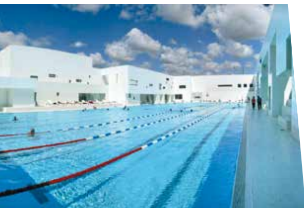
L'étonnant Bain des Docks de Jean Nouvel