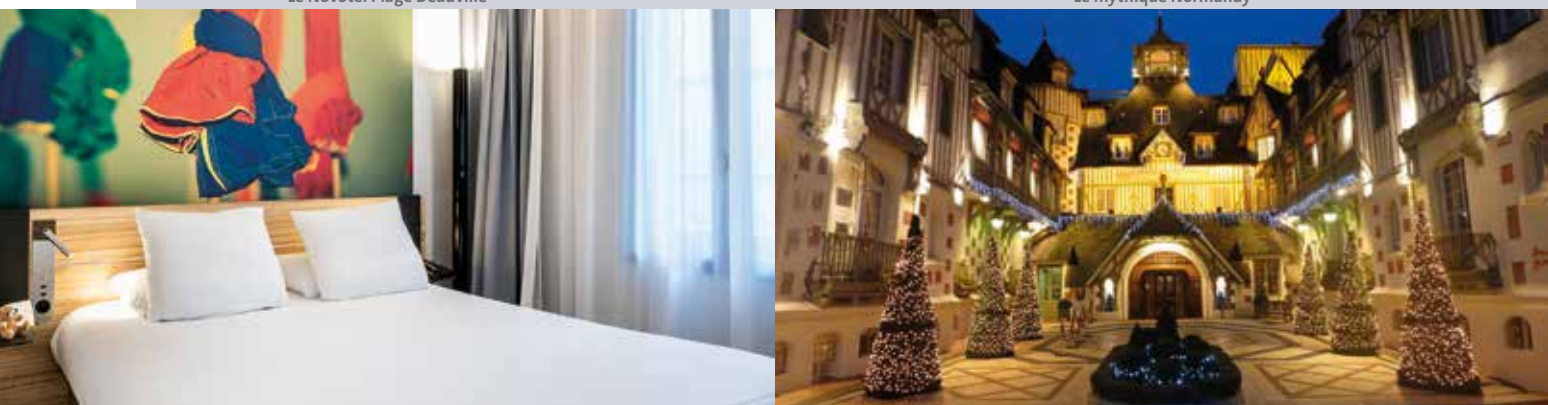
Le mythique Normandy