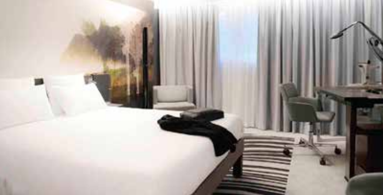
Une chambre du Novotel Caen