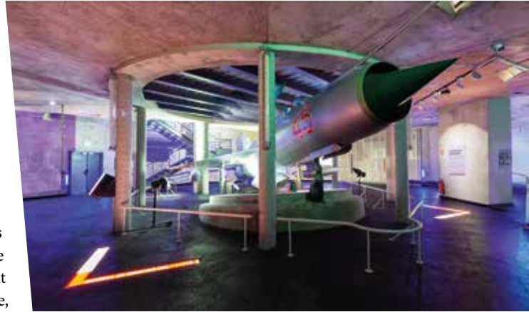
Le Mémorial de Caen

Parmi les restaurants les plus en vue, Ivan Vautier , seul étoilé Michelin depuis la fermeture provisoire d'À Contre Sens (carte de spécialités normandes, 45 places), Gustave , une belle brasserie, face à la mairie, agrémentée d'une verrière structurée par Eiffel (plats du terroir, 100 places), Stéphane Carbone , table créative à deux pas du port de plaisance (40 personnes), La Vraie Vie pour son décor de bistrot et sa carte mer et terre élaborée par Mathieu Évrard, un ancien de Taillevent et Apicius, Séquence , l'ex MCP qui joue une belle partition gastronomique (30 personnes), La Table des Matières , sur le port de plaisance, une autre table gastronomique de renom (50 places), Le Petit B , une table qui marie élégamment un cadre traditionnel à une décoration moderne raffinée (40 personnes en salle et terrasse), La Voile Blanche à Ouistreham pour sa vue mer et sa jolie carte de la mer et de la terre (80 personnes et terrasse).