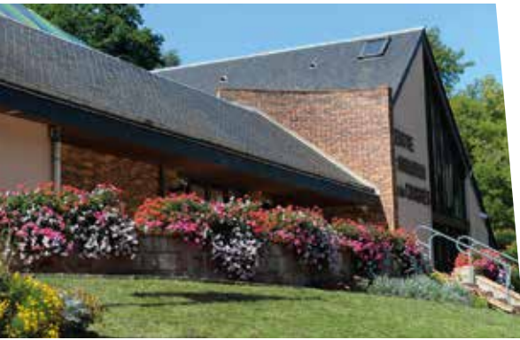
Centre d'animation et de Congrès

Son casino, ses thermes, ses palaces et ses villas chics témoignent de la place qu'occupait la station à la Belle Époque. Labellisée Green Destinations, Bagnoles de l'Orne est aujourd'hui une référence en matière de bien-être et de développement durable au cœur d'un domaine forestier de plus de 7000 hectares.