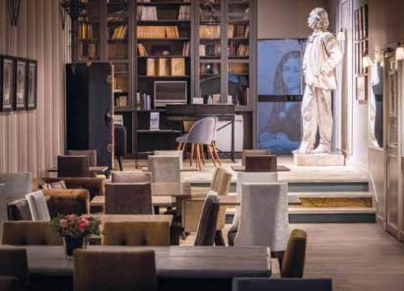
Salon de l'Hôtel Littéraire Gustave Flaubert

Hôtel Littéraire Gustave Flaubert**** (53 chambres) : c'est pour partager sa passion des livres et de la littérature que Jacques Letertre a lancé la collection des hôtels littéraires qui comptent 6 établissements en France. Dédié à Gustave Flaubert, celui de Rouen occupe un immeuble tranquille du centre. Belles chambres littéraires (livre de Gustave à disposition), pas de restaurant, bar, librairie, fitness, espace de coworking, 4 salles de réunion.