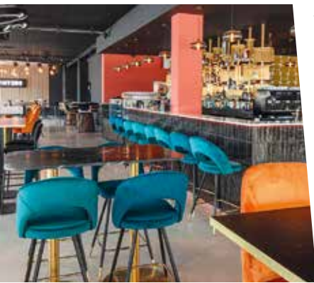
Le Restaurant Pintxos