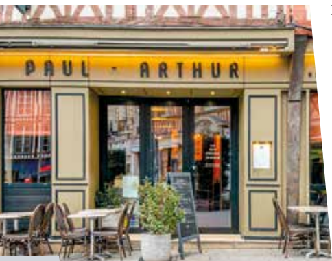
La belle demeure de Paul-Arthur

À Canteleu, à 15 min du vieux Rouen, le Château des deux Lions , un superbe édifice du xvii e siècle entouré d'un parc réaménagé en lieu évènementiel de prestige (3 salons pour 40 personnes) avec une marquise sur la terrasse (300 personnes). Un peu plus loin, à Saint-Cyr, il est possible de privatiser le Carré Saint-Cyr , une ancienne église du xv e siècle qui peut accommoder de 20 à 150 personnes pour un cocktail ou un séminaire.