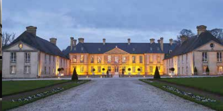
Le Château d'Audrieu

chambres qui va s'achever en fin d'année. Belle structure colorée qui intègre une salle de petit-déjeuner, un bar et 12 salles de réunion (jusqu'à 300 personnes).