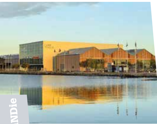
Le Carré des Docks

Son port, créé par François 1 er , est plus que jamais au cœur de l'activité MICE de cette métropole atypique qui séduit de plus en plus les organisateurs de congrès et de séminaires.