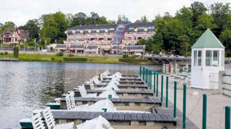
L'hôtel Spa du Beryl