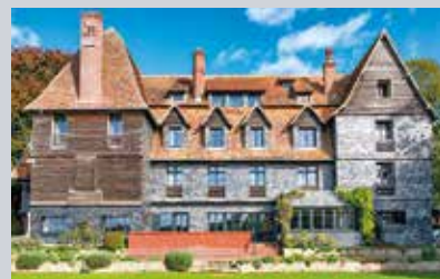
Les Jardins de Coppélia

somptueuse bâtisse d'inspiration augeronne des XVI e et XVII e siècles reconvertie en un petite bonbonnière intimiste que l'on peut privatiser pour un groupe. Restaurant, bar, piscine extérieure, salle de réunion de 50 places.