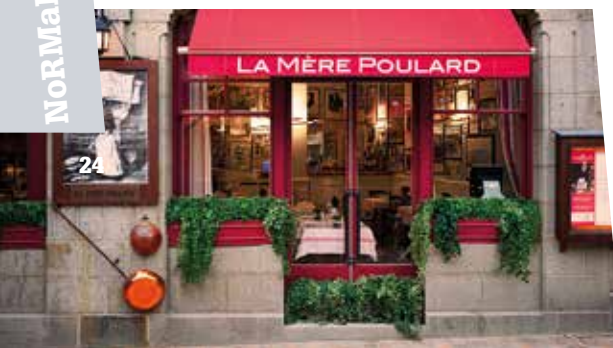
L'Auberge de la Mère Poulard

On le sait peu, mais le Mont Saint-Michel est une commune à part entière située dans le département de la Manche, donc rattachée à la région Normandie, même si beaucoup l'attribuent à la région Bretagne (on est à 50 km à peine de Saint-Malo). Une commune accessible 24h/24 qui ne compte aujourd'hui que 18 habitants – les Montois – auxquels s'ajoute une douzaine de moines et de sœurs reclus dans l'Abbaye qui domine le mont. Mais une commune qui voit défiler chaque année près de 3 millions de visiteurs qui envahissent ses ruelles étroites conduisant jusqu'au sommet, où s'élance une statue de Saint-Michel qui domine à 157 m au-dessus de la baie. Classé en 1979 au patrimoine mondial de l'Unesco, le Mont Saint-Michel est la propriété de l'État qui en a confié la gestion à l'Établissement Public du Mont Saint-Michel, en charge de sa sauvegarde et de l'accueil des visiteurs, dont quantité d'Américains et de Japonais. C'est aujourd'hui un incontournable des circuits touristiques, la plupart des visiteurs ne restant sur place que quelques heures, le temps de déambuler dans le village et de découvrir l'abbaye, même si de plus en plus choisissent d'y passer une nuit dans un des hôtels intra-muros ou le plus souvent dans les établissements situés juste avant le pont qui relie la côte au mont. Dans tous les cas, les visiteurs sont assurés de vivre un moment unique au cœur d'un site millénaire qui n'a pas d'équivalent dans le monde.