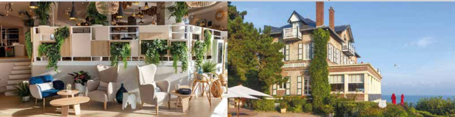
Dormy House à Étretat