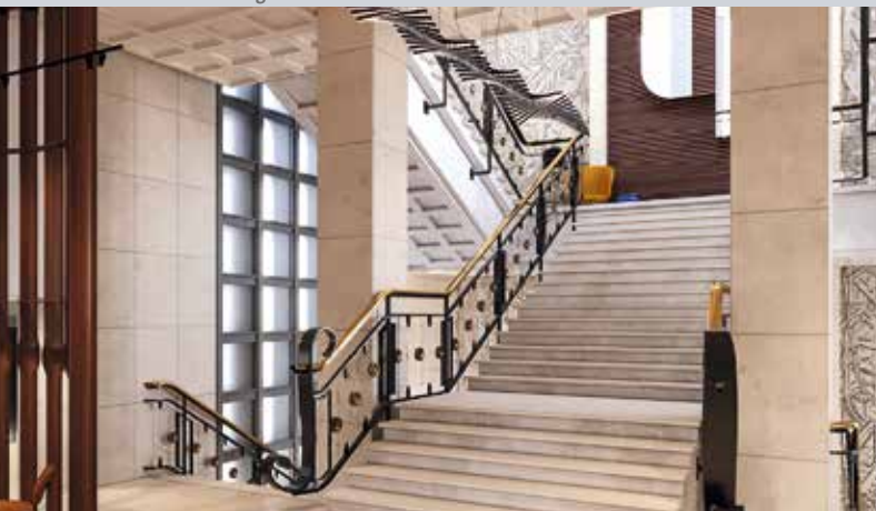
Le magistral escalier d'honneur du Novotel Rouen Suites

Aparthotel Adagio*** (75 chambres) : c'est l'autre pièce du puzzle dans l'ancien siège de la CCI. Une résidence de bon standing qui s'accompagne de services hôteliers, à l'exception d'un restaurant, les résidents ayant accès à celui du Novotel, comme ils auront accès à sa piscine.