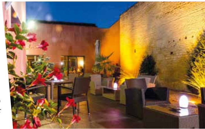
Le restaurant Ivan Vautier