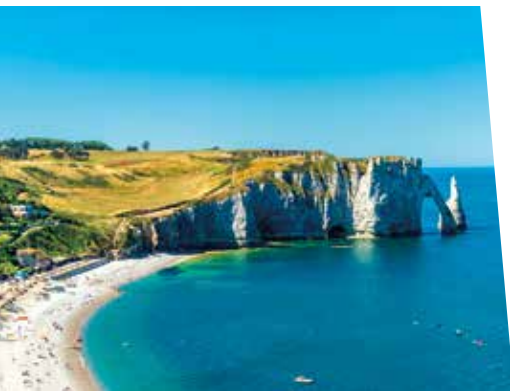
Les falaises d'Étretat