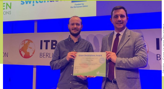
Remise du label lors de la cérémonie à l'ITB Berlin.

Ce mercredi 6 mars 2024 à Berlin, Caen la mer a été distinguée au niveau international par Green Destinations, une organisation mondiale dédiée au tourisme durable.