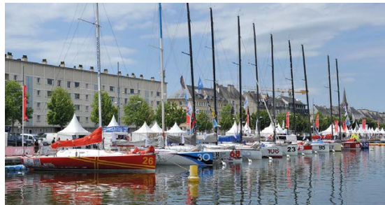
Le port de plaisance.

Caen est une ville attractive qui séduit des visiteurs du monde entier venus découvrir ses abbayes romanes, son château médiéval, ses hôtels particuliers, ses musées dont le Mémorial de Caen, qui lui a valu le titre de « Ville pour la Paix » décerné par l'UNESCO en 1999. Avec pas moins de 81 édifices classés, Caen est surnommée la « ville aux cents clochers ».