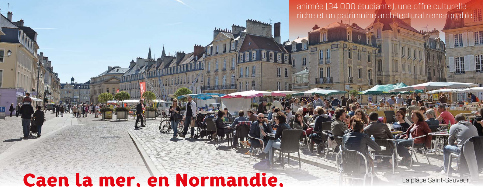
La place Saint-Sauveur.

Caen est une ville à taille humaine aux multiples attraits : un port de plaisance en coeur de ville, de vastes espaces verts, une gastronomie réputée avec notamment 3 chefs étoilés, une vie nocturne animée (34 000 étudiants), une offre culturelle riche et un patrimoine architectural remarquable.