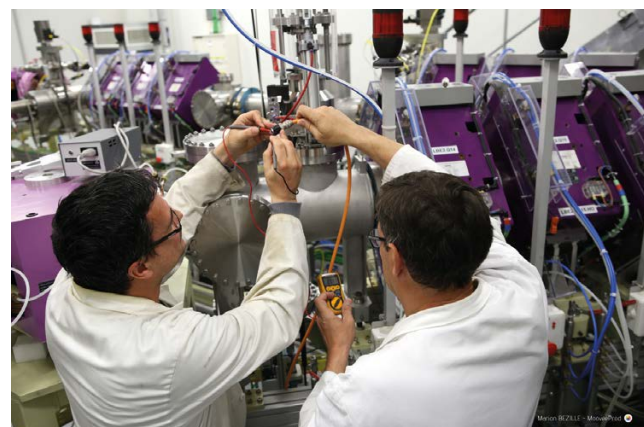
Ganil - Spiral2.

Le berceau de la technologie NFC (Near Field Communication ou « paiement sans contact ») Labellisé «French Tech Caen Normandy» 2019