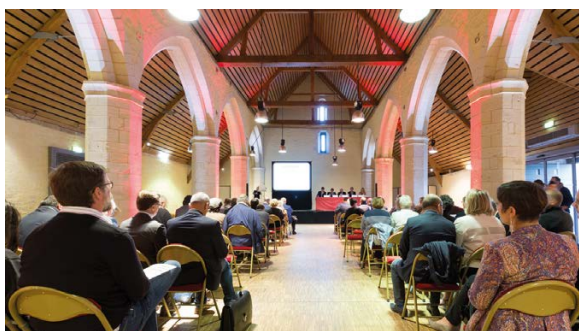
Le domaine la Baronnie