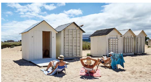
Ouistreham - Riva-Bella.

Caen est une ville attractive qui séduit des visiteurs du monde entier venus découvrir ses abbayes romanes, son château médiéval, ses hôtels particuliers, ses musées dont le Mémorial de Caen, qui lui a valu le titre de « Ville pour la Paix » décerné par l'UNESCO en 1999. Avec pas moins de 81 édifices classés, Caen est surnommée la « ville aux cents clochers ».