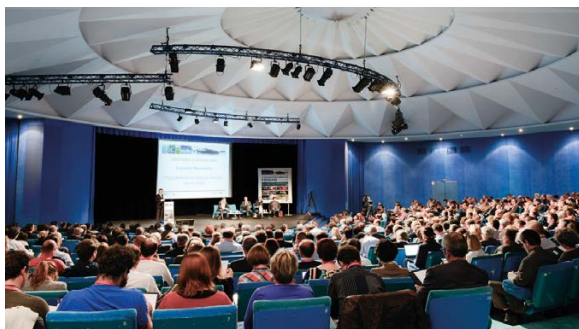
Le centre de congrès.

Nous vous proposons un vaste choix de lieux événementiels en ville, en bord de mer ou au vert pour accueillir vos événements professionnels (congrès, séminaires, conventions, conférences, assemblées générales, soirées de gala...) jusqu'à 4 500 personnes.