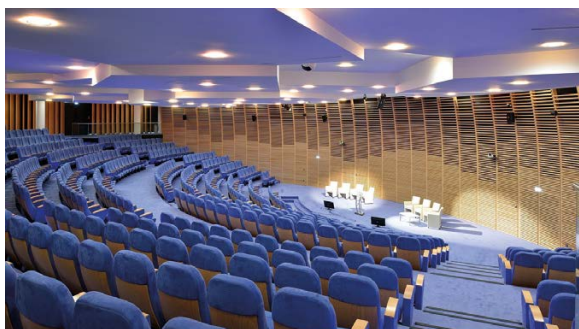
Le centre de conférence du Crédit Agricole.