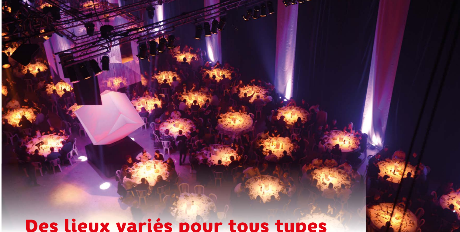
Le Zénith de Caen.